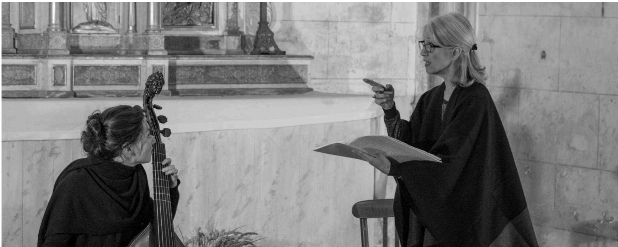
Octobre 2017 – Création de « À l'ombre d'un géant » en Pays Mellois

À l'ombre d'un géant est aussi le lieu d'une rencontre entre François Rabelais et deux musiciens. D'ailleurs, d'autres temps, et pourtant... L'un, Tobias Hume naît en 1569 en Angleterre. Il est soldat et compositeur. Entre drôlerie et profonde mélancolie, ses pièces sont comme conteuses d'états d'âme. L'autre se nomme Jean de Sainte Colombe et naît en 1640 en France. En témoignage d'une existence très solitaire, il nous laisse une musique d'une sensibilité rare. Les pièces de ces deux compositeurs aux écritures si personnelles, racontent. Les racontent. Alors, tout comme le conte dont elles se font l'écho, ces musiques traversent le temps sans prendre une ride... »